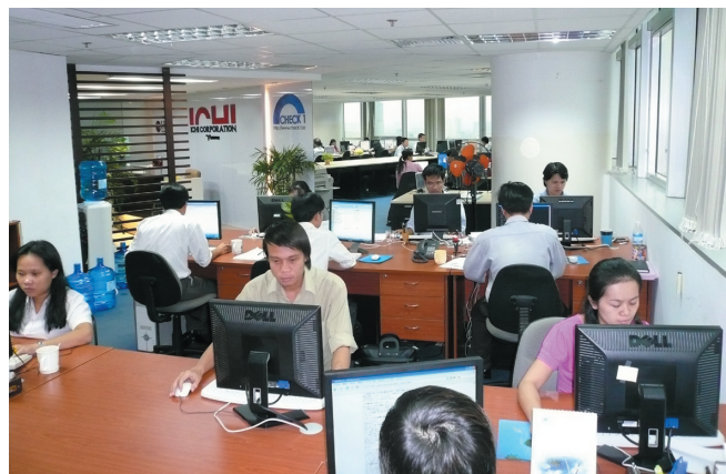
イチコーポレーションベトナム(ホーチミン市)事務所風景