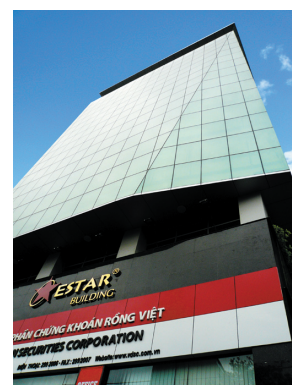
Ho Chi Minh City Office #7 ESTAR BUILDING